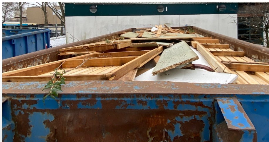
Holzabfälle nach Abbrucharbeiten