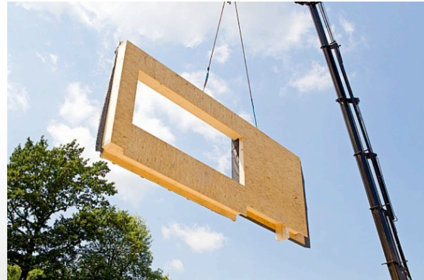
Abbildung 3: Modulare Bauteile aus Holzwerkstoff