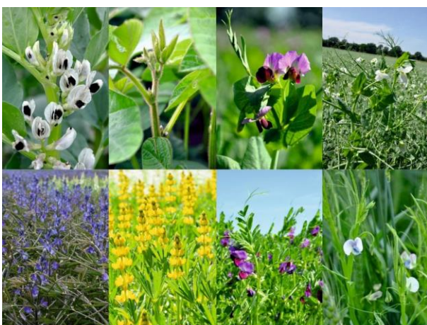
Blütenvielfalt von Körnerleguminosen: Ackerbohne, Sojabohne, Wintererbse, Sommererbse, Blaue Lupine, Gelbe Lupine, Saatwicke, Platterbse