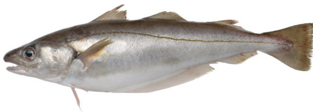
Wittling { Merlangius merlangus }