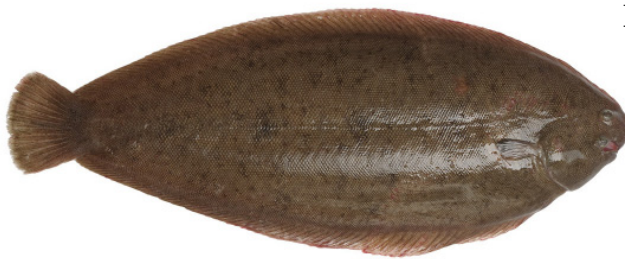
Seezunge { Solea solea }