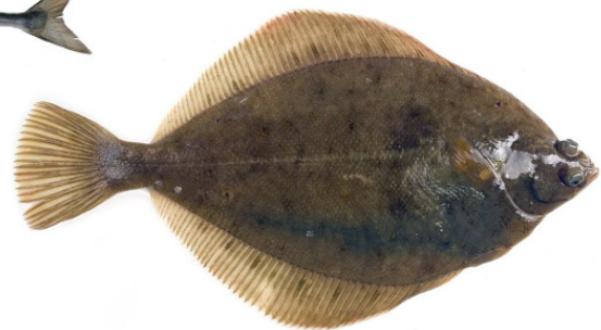
Kliesche { Limanda limanda }