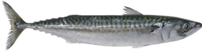
Makrele { Scomber scombrus }