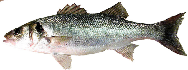
Wolfsbarsch { Dicentrarchus labrax }