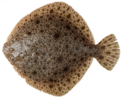
Steinbutt { Scophthalmus maximus }