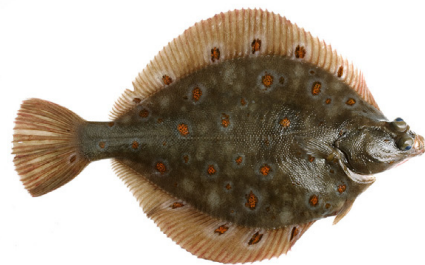
Scholle { Pleuronectes platessa }