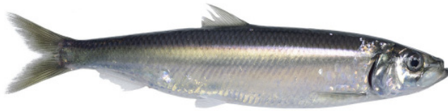
Hering { Clupea harengus }