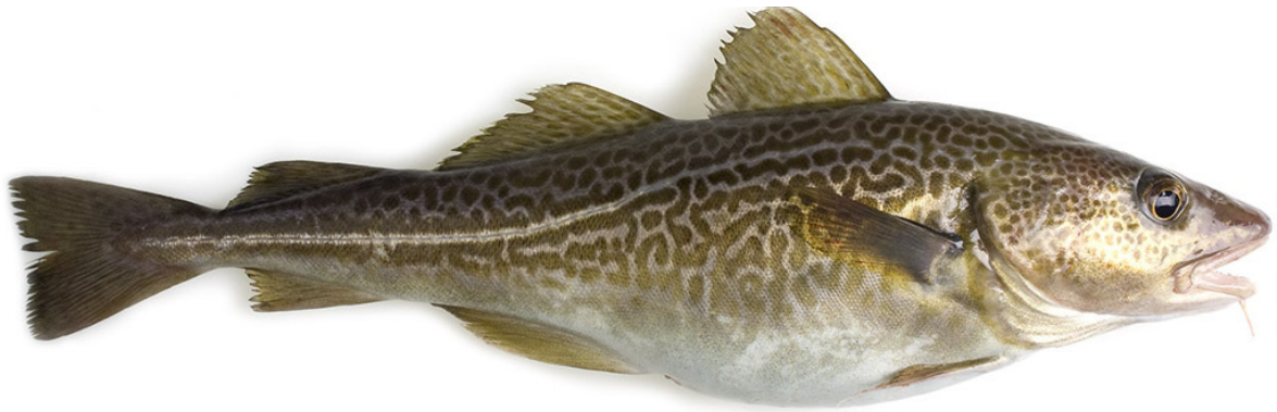
Dorsch/Kabeljau { Gadus morhua }