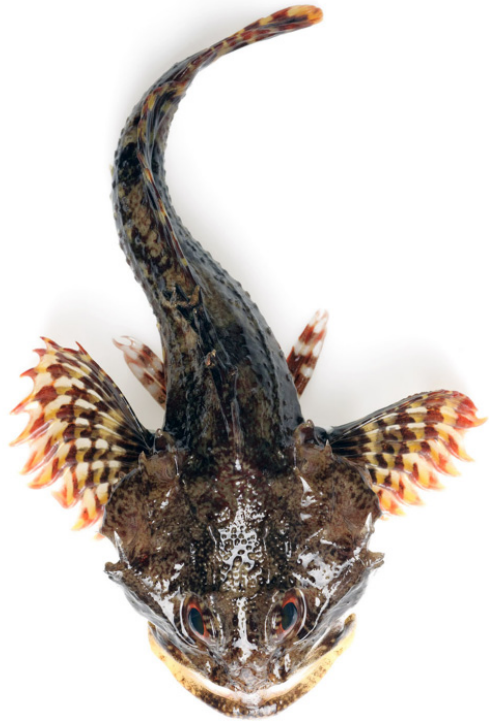
Seeskorpion { Myoxocephalus scorpius }