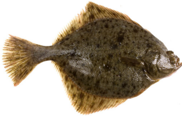
Flunder { Platichthys flesus }