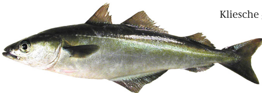
Köhler/Seelachs { Pollachius virens }