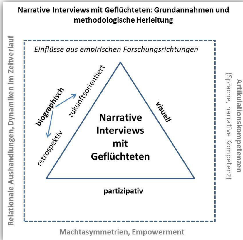
Abbildung 1: Narrative Interviews mit Geflüchteten