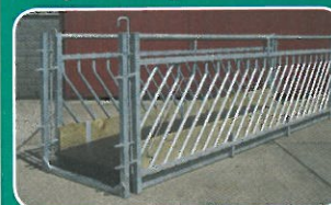
The Walk through Futtergatter