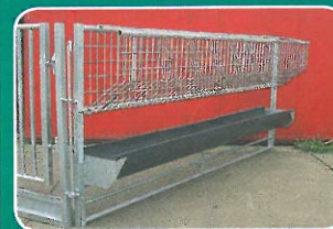
Futtergatter mit Trog und Raufe