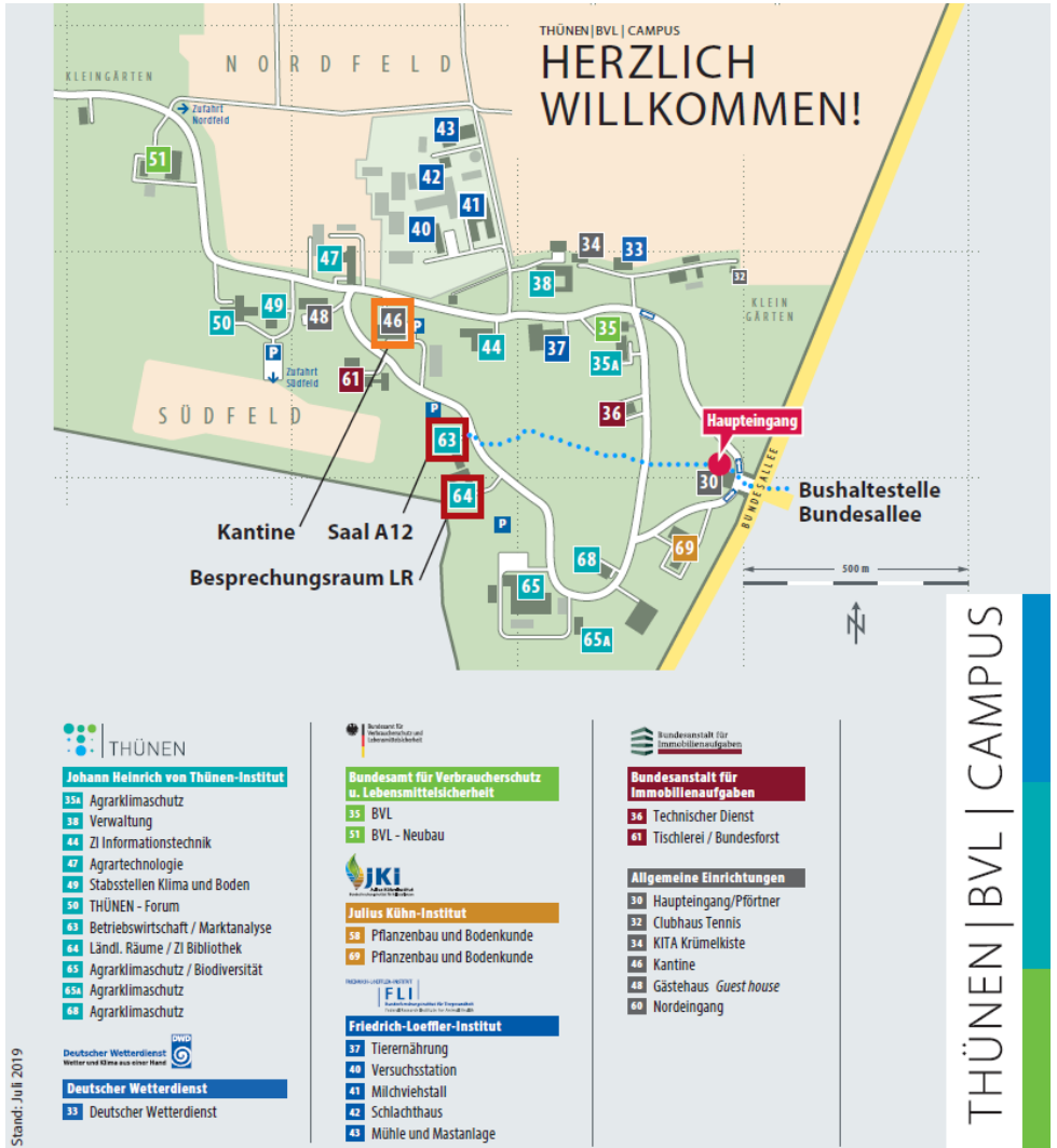
Abbildung 2: Geländeplan Campus, Ausschnitt Süd, Bundesallee 30-69, Braunschweig

Die Bushaltestelle Bundesallee bedient die Linien 411, 433, 461, 560. Linie 461 fährt zum Hauptbahnhof. Informationen zum öffentlichen Nahverkehr finden sich unter bsvg.net .