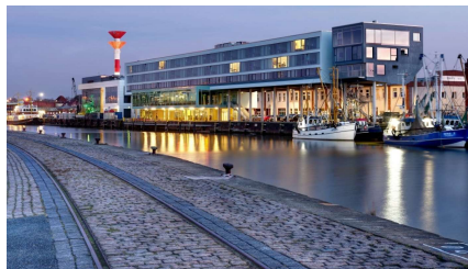
Best Western Plus Hotel Bremerhaven Fischkai 2 27572 Bremerhaven