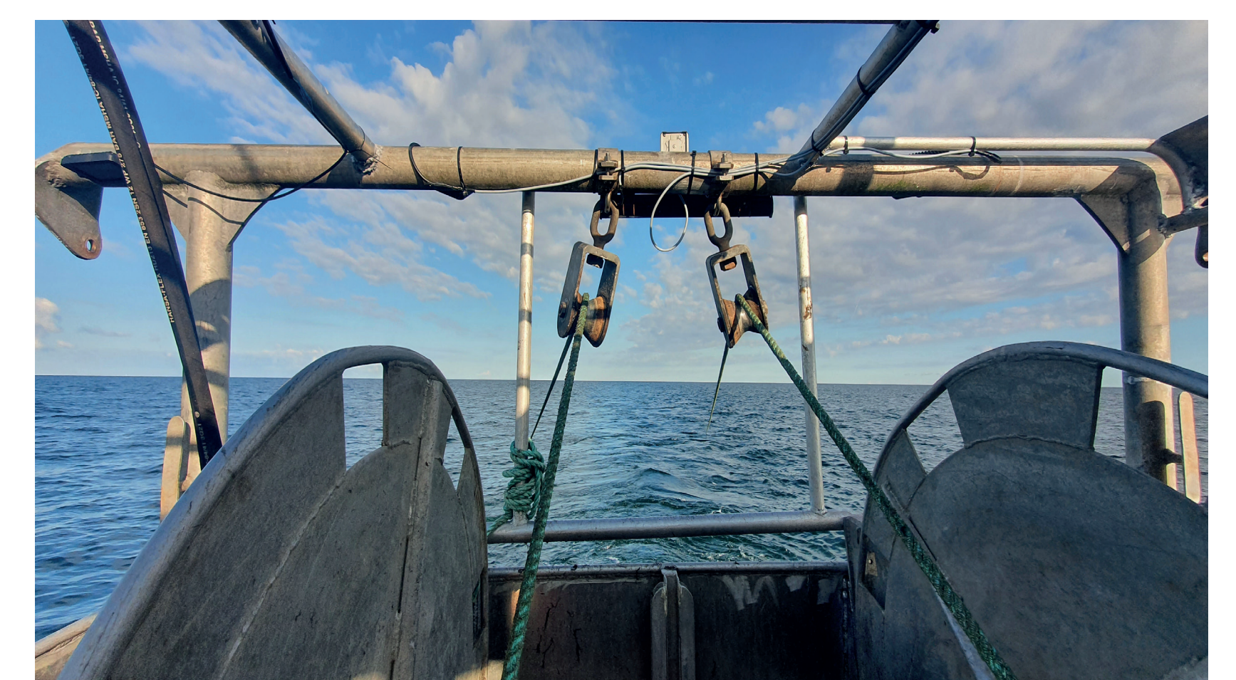
Kleine Winde für die MiniSeine

Fraßschäden durch Robben an gefangenen Fisch können auch durch den Einsatz der MiniSeine reduziert werden: eine kleine Snurrewade, die auch von kleinen Kuttern eingesetzt werden kann.