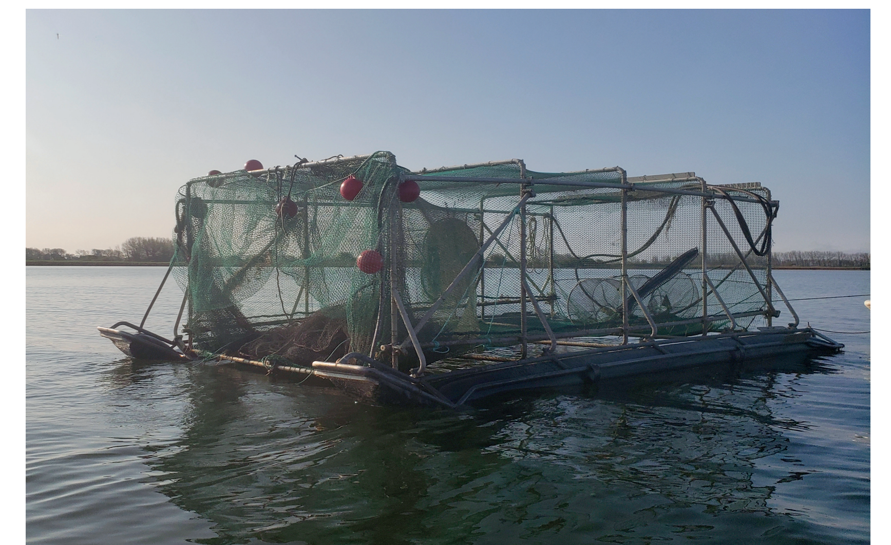
Oben: Pontonhebereuse, unten: moderne Fischfalle

Mit robbersicheren Fanggeräten können – anders als mit Stellnetzen – a) gefangene Fische vor Robbenfraß und b) Robben vor Beifang geschützt werden. In der Pontonhebereuse und in Fischfallen geschieht dies beispielsweise durch eine feste Fangkammer und einen definierten Eingang.